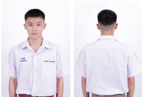
ทรงผมนักเรียนชาย (กรณีผมสั้น)