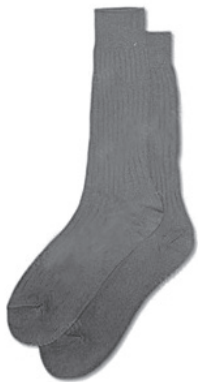
นักเรียนหญิง